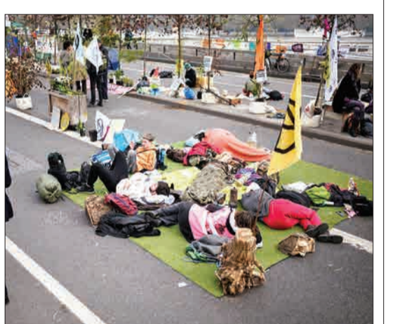
لندن، انگلیس - معترضان و فعالان زیست‌محیطی در دومین روز از اعتراضشان، خیابان‌ها را مسدود کرده‌اند.