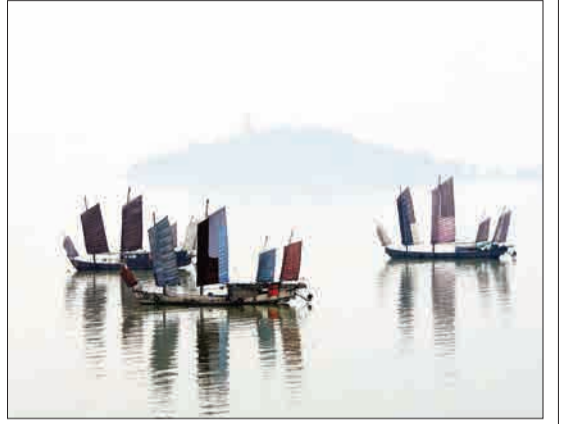
دریاچه تایهو، چین - قایق‌های ماهیگیری در مه صبح دم استراحت می‌کنند.