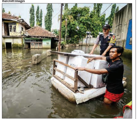
باندونگ، اندونزی - مقامات در حال انتقال برکه‌های رأی‌گیری در مناطق سیل‌زده هستند.