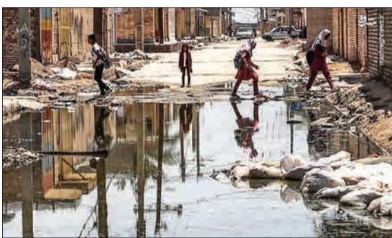
▲ حدود یک ماه از آغاز بحران سیل در استان خوزستان می‌گذرد و با فرود آمدن آب در بعضی از مناطق، مردم به منازل خود بازگشته‌اند. منطقه عین‌دو که چند سالی است جزو محدوده شهری اهواز به حساب می‌آید و یکی از مناطق کمتر توسعه‌یافته آن است، همچنان دچار آبگرفتگی و ترکیب سیلاب با فاضلاب است و صحنه ناخوشایندی از وضع بد زندگی مردم این منطقه را نشان می‌دهد. (مشرق)