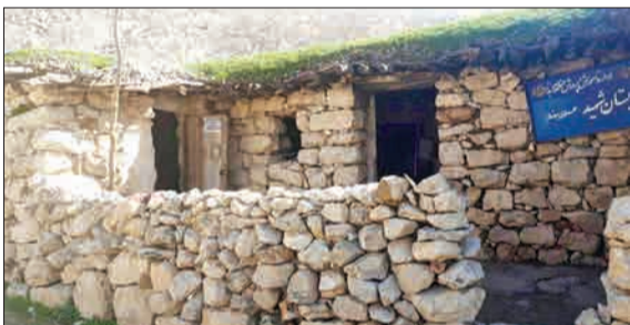
▲ وضعیت خطرناک مدرسه روستای برد زرد از توابع بخش دهدز ایذه در خوزستان.