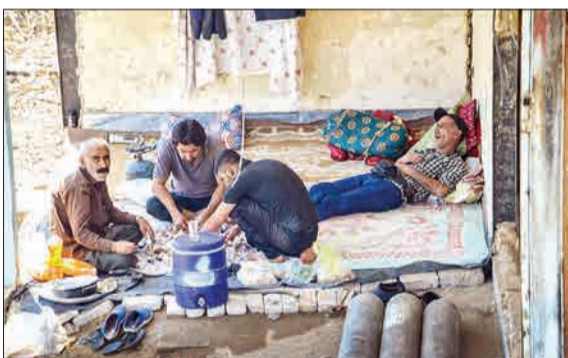
▲ این روزها روح زندگی در شهر پلدختر رفته رفته در حال جاری شدن است و مردم در تلاش برای بازگشت به زندگی عادی خود هستند.