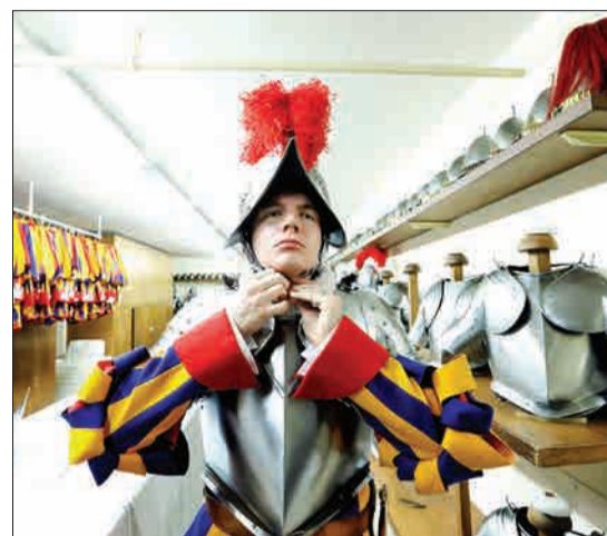
یکی از نیروهای تازه‌استخدام شده واتیکان، خود را برای مراسم سوگند آماده می‌کند.