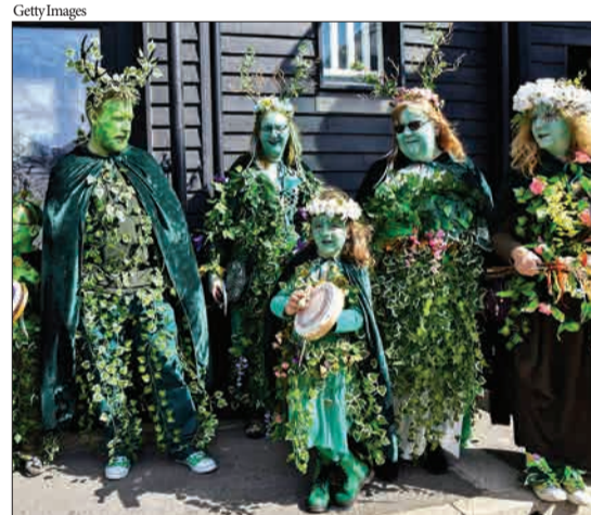
هستینگز، انگلیس - افرادی که شاخ و برگ را از لباس‌های خود آویزان کرده‌اند و نزدیک شدن تابستان را جشن می‌گیرند.