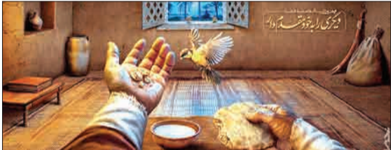
دیوارنگاره جدید میدان ولیعصر (عج) به مناسبت روزهای ماه مبارک رمضان