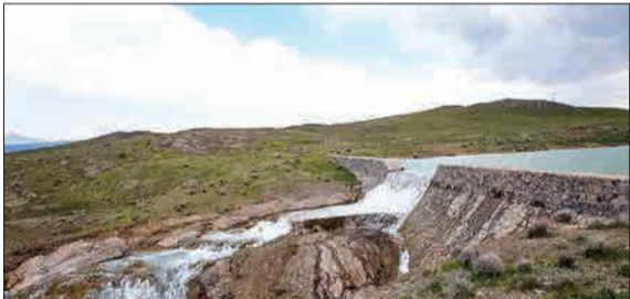
بارش‌های بهاری در شروع سال خسارت‌های زیادی به برخی از شهرهای کشور وارد کرد. یکی از شهرهایی که بنا بر پیش‌بینی‌های انجام‌شده شاهد میهمان ناخواسته «سیل» باید می‌بود، شهر قم بود. اما مردم تنها شاهد طغیان رودخانه‌های فصلی بودند و خبری از سیلی شبیه به سال ۸۶ و خسارت سنگین آن نبود. آبخیزداری و آبخوانداری پروژه‌هایی اجرا شده در بالادست حوض‌های آبی استان قم‌عامل کمتر ۱۰۰ میلیون مترمکعب آب و شکستن سیلاب در قم بود. (ایستا)