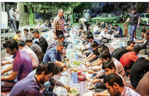
هیات حضرت ابوالفضل (ع) در بلوار ابوذر خیابان پیروزی تهران هر ساله در ایام ماه مبارک رمضان با پهن کردن سفره افطار در خیابان مجاور هیات از رهگذران و اهالی محل هنگام افطار پذیرایی می‌کند. (مهرا)