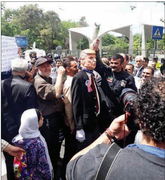
نمازگزاران تهران با حضور در هیئتی حمایت قاطع خود را از تصمیم شورای عالی امنیت ملی مبنی بر کاهش تعهدات برجامی به دنبال بدعهدی طرفین مذاکره کننده اعلام کردند. در این تصویر راهپیمایان اعتراض خود را به رفتار گستاخانه‌آمیز پانزدهمین هیئت امنای این سازمان دادند. (ایستا)