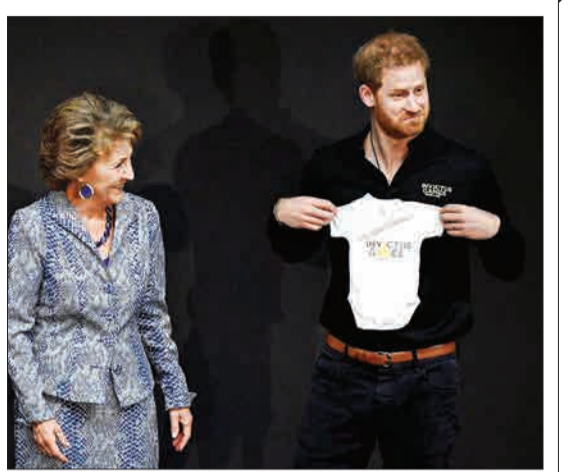
هلند - پرنس هری لباسی را که برای فرزندش دریافت کرده، نشان می‌دهد.