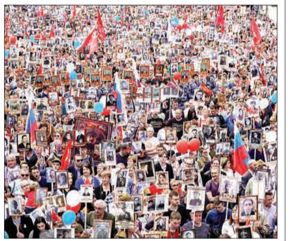
مسکو، روسیه - در جشن سالگرد پیروزی شوروی بر نیروهای آلمان، مردم تصاویر اعضای خانواده و بستگانشان را که در جنگ جهانی دوم کشته شده‌اند را در دست گرفته‌اند.