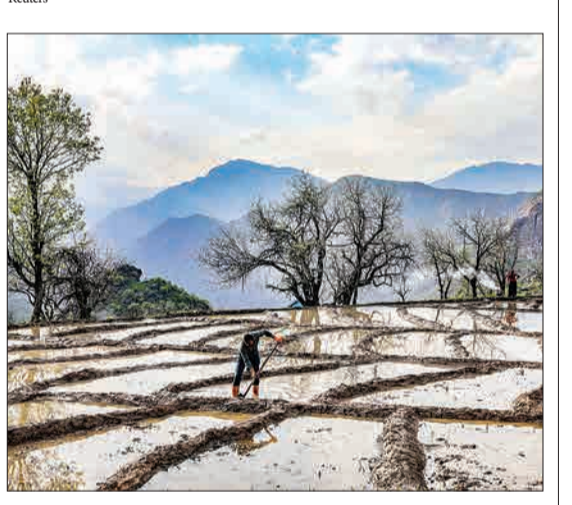
ترکیه - یک کشاورز در حال کار در شالیزار برنج است.