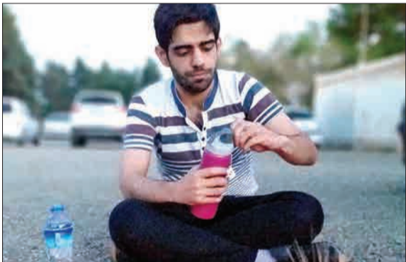
یکی از طرفداران پرسپولیس که برای حمایت از تیم محبوبش به ورزشگاه آزادی رفته بود. این طور سفره افطار خود را روی زمین پهن کرد و پس از شنیدن نوای ملکوتی اذان مغرب، شروع به افطار کرد. سفره افطار این تماشاگر فوتبال، پرچم تیم محبوبش یعنی پرسپولیس بود. (خبر آنلاین)