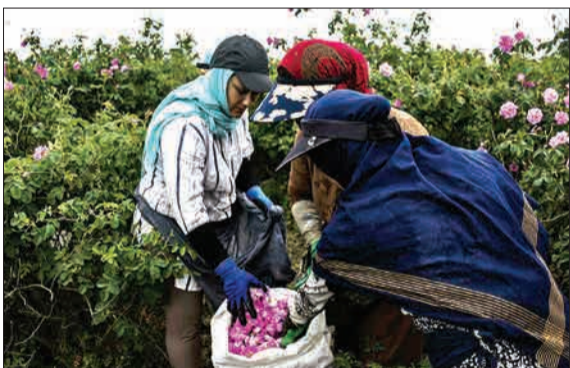
برداشت کل محمدی در روستای «الله رودبار» از توابع بخش مرکزی شهرستان بابل در استان مازندران از اواسط اردیبهشت ماه آغاز شده است.