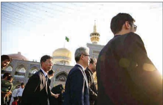
یو جانگ هیان، سفیر کره جنوبی، به منظور دیدار با مسئولان شهر مقدس مشهد، در سفری سه روزه عازم این شهر شد. (مشرق)