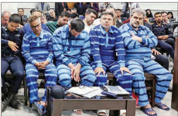
نخستین جلسه رسیدگی پرونده موسوم به شرکت پدیده، روز گذشته به قضاوت قاضی منصوری در دادگاه عمومی و انقلاب مشهد برگزار شد.