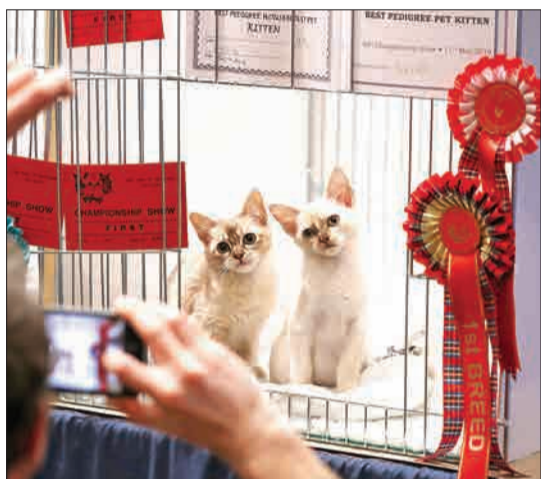
اسکاتلند - دو بچه گربه در نمایش گربه هادر باشگاه سیامسی.