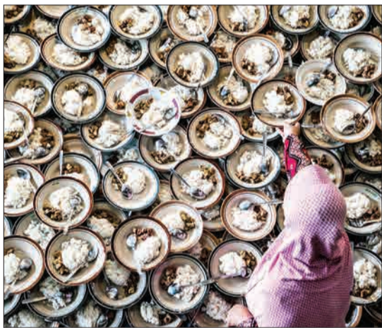
اندونزی - زنی در حال آماده کردن فطاری برای مسلمانان است.