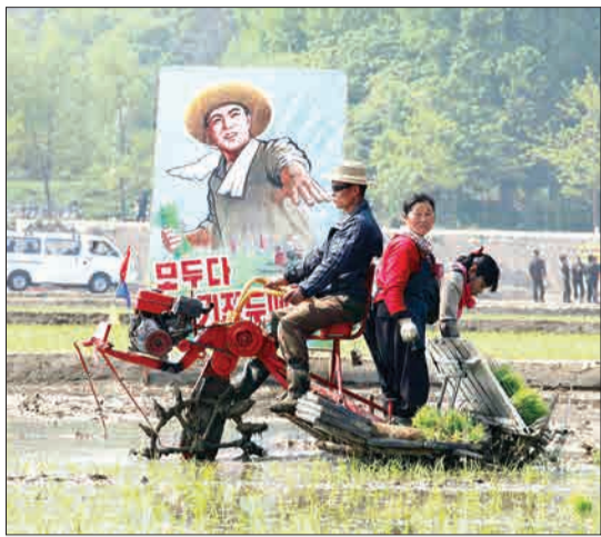
کره شمالی - کشاورزان در حال کاشت بذرهای برنج در شالیزار هستند.