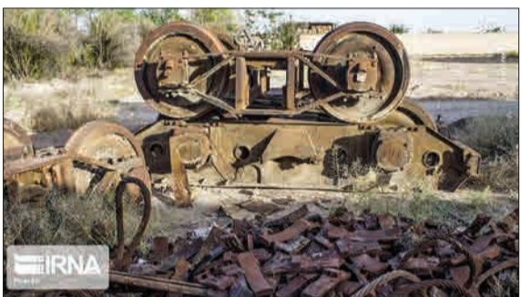
این تصویر مربوط است به تعمیرگاه هشتاد ساله لکوموتیوها در سمنان که به تکه دار و تعمیرات لکوموتیوهایی که دچار نقص فنی شده اند، اختصاص دارد. (ایران)