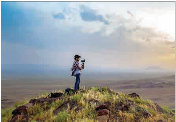
پس از حدود ۱۰ سال خشکسالی در استان قم و کاهش شدید سفره های آب زیرزمینی و عبور از وضع بحرانی آب در استان قم، با بارندگی های بهاری در سال جاری چهره قم طراوت و زیبایی خاصی پیدا کرده است و دشت ها و حاشیه تمامی جاده ها و راه های استان که تا پیش از این شاهد زمین های بایر و خشک بود این روزها به سبزه و شادمانی چهره ای سبز دارد. این بارش ها به گونه ای بوده که به گفته کارشناس هواشناسی در ۳۲ سال گذشته بی سابقه بوده است.