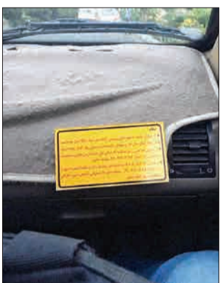
این راننده تاکسی روی داشبورد خود نوشته: «از سربازان وظیفه به هیچ عنوان وجهی گرفته نمی شود. لطفا اصرار نفرمایید. اگر واقعا تمکن مالی ندارید، میهمان راننده باشید و بدون بیان کردن پیاده شوید. در صورتی که کسی را می شناسید که تمکن مالی ندارد، آدرس دقیق و مشخصات شخص را به شماره... پیامک کنید. در صورتی که تمایل به کمک به اشخاص نیاز مند را دارید، لطفا شماره خود را به شماره... پیامک کنید تا با معرفی شخص مورد نظر نگران مستقیما به او کمک نمایید.» (مشرق)