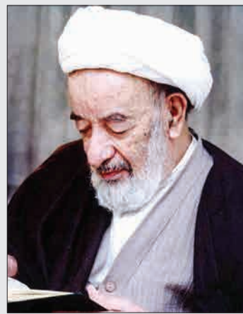
نقل شده از آیت‌الله‌ری شهری

«زندگی آیت‌الله حق شناس دارای نکات نابی است. مانند این که نقل شده است روزی ایشان به مسجد می‌رفتند که ملاحظه کردند جوانانی آتش روشن کرده و در حال قمار بازی هستند. این عالم بزرگوار برای امر به معروف جلو می‌روند تا همان گویش همیشگی خود می‌فرمایند «داداش چه کار می‌کنی.» آنان پاسخ می‌دهند: «آتش روشن کرده‌ایم تا گرم شویم و مجدداً ایشان می‌فرمایند «خب به قهوه‌خانه مسجد بیا بید جای بخورید و گرم شوید و ما هم باشما کاری نداریم و کار خودمان را انجام می‌دهیم.» همین یک کار حق و مهربانانه ایشان موجب می‌شود این جوانان قمار باز در جبهه شهید شوند.»