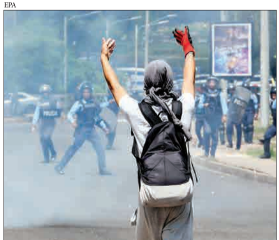
هندوراس - مقابله دانشجویان بانیروهای پلیس در تظاهرات ضد دولتی.