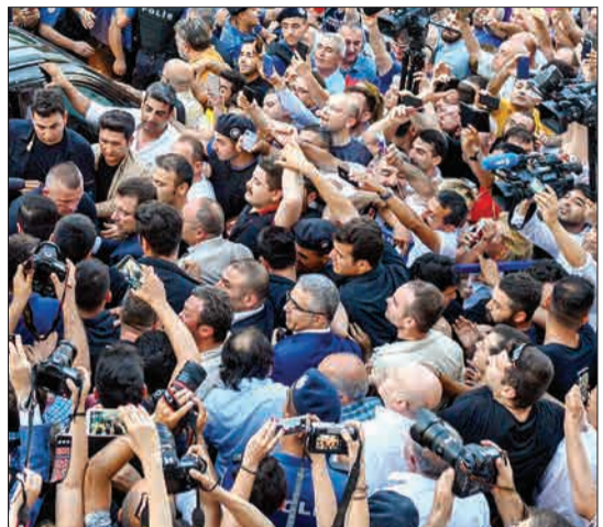
استانبول، ترکیه - اکرم امام‌اوغلو شهردار منتخب استانبول در حزب مخالفان سکولار پس از پیروزی در انتخابات توسط مردم و خبرنگاران احاطه شده است.