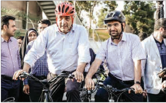
محمدجواد آذری جهرمی و پیروان صبح معرک گذشته‌تیس از افتتاح ۱۱ ایستگاه جدید دوچرخه‌داری پایتخت، پایتخت‌شدند و از میدان توحید تا پارک‌الهدی خیابان‌کارگر شمالی دوچرخه‌سواری کردند. (باشگاه خبرنگاران جوان)