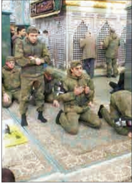
افزایش تعداد تن‌سازان مسلمان روس در حرم حضرت زینب (س) در شهر دمشق (سوریه، مشرق)