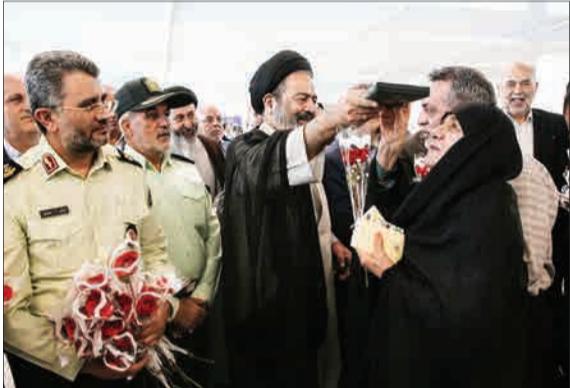
مراسم بدرقه نخستین گروه از نهران بیت‌الله الحرام، با حضور نماینده ولی فقیه در امور حج و زیارت و رئیس سازمان حج و زیارت در سالن سلام فرودگاه بین‌المللی امام خمینی (ره) تهران برگزار شد.