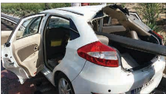
یک دستگاه ام‌وی‌ام در مسیر غرب به شرق بزرگراه آرادگان در حال حرکت بود که به علت نامشخصی از مسیر اصلی منحرف شد و به شدت با گاردیل کنار بزرگراه برخورد کرد. به‌طوری‌که گاردیل فلزی به طرز خطرناکی وارد خودرو شد. بر اثر این حادثه، یکی از گاردیل‌های فلزی به طول حدوداً ۱ متر از قسمت موتور خودرو وارد و از صندوق عقب آن خارج شد. خوشبختانه سرنشینان که دو مرد ۳۵ و ۳۰ ساله بودند، به‌طرز عجیبی از این تصادف جان سالم به‌در بردند ولی به‌سختی مجروح شدند که یکی از آنان با کمک رانندگان از داخل خودرو خارج شد. نفر دیگر که راننده خودرو بود، با توجه به فتن شدن در میان اتاقک متلاشی شده، بعد از حضور آتش‌نشنان و در حضور عوامل اورژانس و بعد از برش قسمت‌هایی از اتاقک خودرو، از داخل آن بیرون آورده و تحویل تکنیسین‌های اورژانس شد. (آتش‌نشانی)