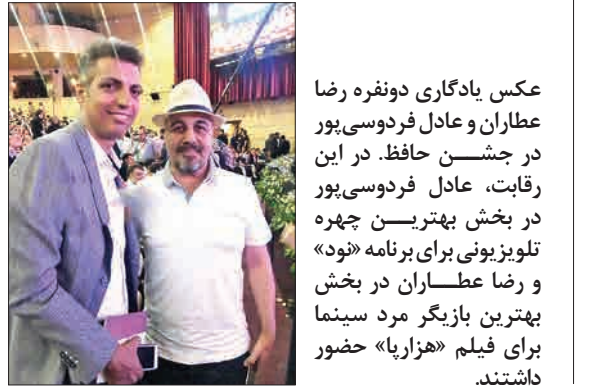
عکس یادگاری دونفره رضا عطاران و عادل فردوسی پور در جشن حافظ. در این رقابت، عادل فردوسی پور در بخش بهترین چهره تلویزیونی برای برنامه «نود» و رضا عطاران در بخش بهترین بازیگر مرد سینما برای فیلم «هزارپا» حضور داشتند.