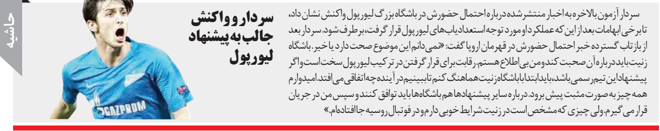
سردار واکنش جالب به پیشنهاد لیورپول