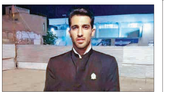
وحیدامیری، بازیکن ملی پوش کشورمان با حضور در حرم کریمه اهل بیت، خادم افتخاری آستان مقدس حرم حضرت معصومه (س) شد. او در حاشیه این مراسم البته رسماً اعلام کرد دوباره پیراهن پرسپولیس را بر تن خواهد کرد.