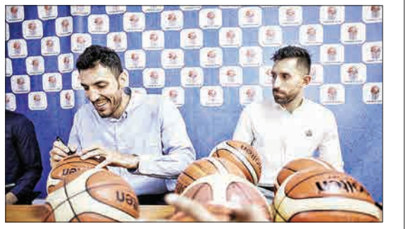
ملی پوشان بسکتبال که خود را برای جام جهانی ۲۰۱۹ در چین آماده می کنند، امروز در یک کار خیر خواهانه شرکت کردند. آنها تعدادی توپ بسکتبال را امضا و به کودکان سرطانی راه آسمان اهدا کردند و باین کودکان بیمار عکس یادگاری گرفتند.