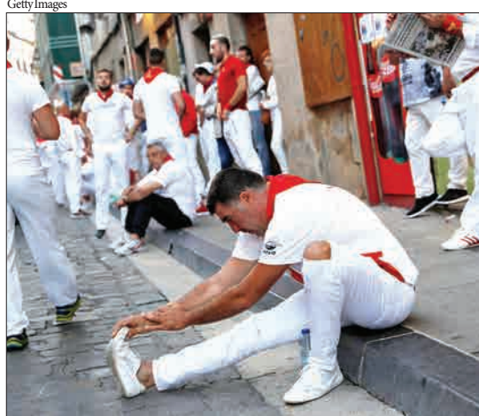
اسپانیا - دوندگاری که پیش از گلوبازی خیابانی در حال استراحت هستند.