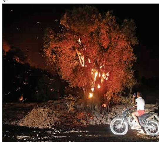
ترکیه - موتورسواری که کنار جاده ایستاده تا از آتش سوزی در جنگل در منطقه دالامان عکس بگیرد.