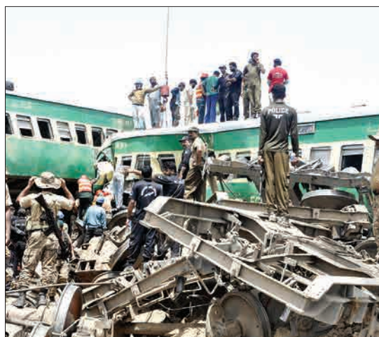
پاکستان - مقامات و نیروهای داوطلب در محل برخورد قطار مسافری مشغول کار کردن هستند. در این حادثه دست کم ۱۱ نفر کشته و تعداد زیادی هم مصدوم شدند.