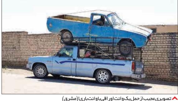
تصویری عجیب از حمل یک وانت اورا اقی با وانت باری (مشرق)