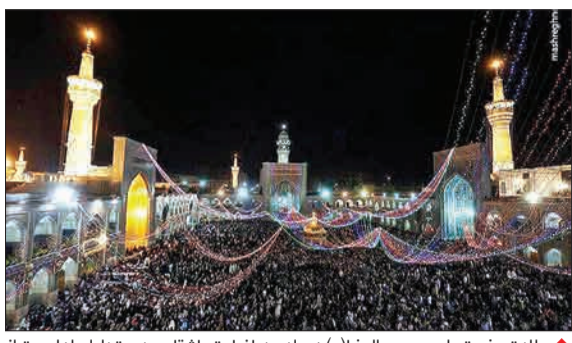
ولادت حضرت علی بن موسی الرضا (ع) همراه بود با زیارت عاشقان و دوستداران اهل بیت از سراسر کشور (مشرق)