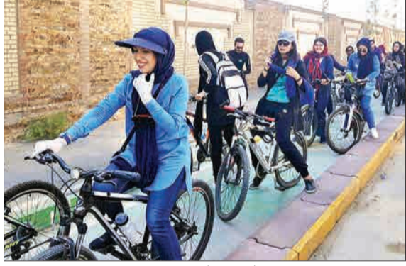
همایش دوچرخه سواری در اراک (عصر ایران)