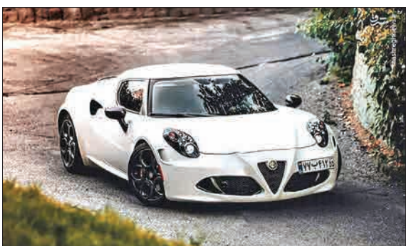
خودروی گرگ نقیتم ایتالیا یا ای Alfa Romeo 4C در تهران، (مشرق)

تحقیقات نشان می دهد که خستگی راننده یکی از عوامل مؤثر در بیش از ۲۰ درصد تصادفات جاده ای و بیش از یک چهارم تصادفات کشنده و جدی است.