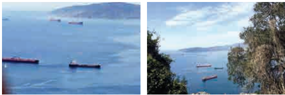
این تصاویر نشان می دهد که نفتکش ایران اسکورت شده و در محافظت شدید امنیتی قرار گرفته است. آخرین خبرها هم از توقیف نفتکش ایران حاکی از آن است که جر می هانت، وزیر خارجه انگلیس با تعیین شروط غیرمنطقی و عده آردی آن را داده است. (فبر تلاین)