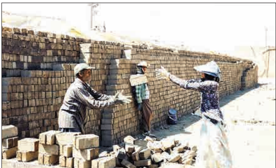
با شروع تابستان، کارگران فصلی به همراه خانواده از مکان های مختلف به کوره های آجرپزی مهدان می آیند و تا شروع پاییز در کوره می مانند و کسب روزی می کنند. کل اعضای خانواده در کار شریک هستند و از صبح تا عصر زیر آفتاب کار می کنند. این کارگرها به دلیل نزدن سیستم کفی دوری از دیار خود را که گاه تا هزار کیلومتر می رسد، تحمل می کنند. (مهر)