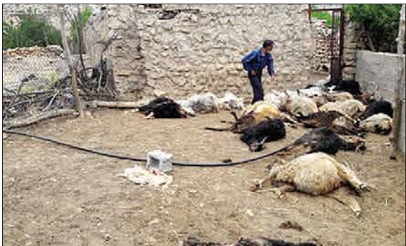
حمله شبانه گرگ وحشی به ۲ روستای داراب، تلفاتی که می بینید را به بار آورده است. ماجرا از این قرار بود که طی شب های گذشته گرگ ها به دور روستای لایزنگان و نونایگان از توابع شهرستان داراب حمله کردند و به برخی از دامداری های این روستا آسیب و زیان رساندند.