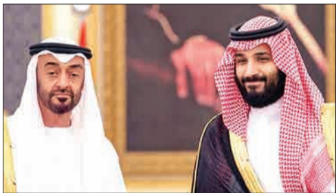
بن زاید و بن سلمان

تمامیت ارضی کشور خلاصه می‌شد. مواجعه دوی و ابوظبی ۴۸ سال از تشکیل امارات متحده عربی می‌گذرد و این کشور منهای توفیقات اقتصادی که در سایه فروش نفت حاصل شده است، هرگز نتوانسته سیاستی در شأن یک کشور مستقل را در پیش بگیرد. این دنباله‌روی و گوش بفرمانی سیاسی خصوصاً حالا که امارات نقش یک پادوی وفادار را برای عربستان سعودی بازی می‌کند بیشتر به چشم می‌آید. این میان پخش شایعاتی مبنی بر بروز اختلاف بین حاکم دوی و ولیعهد ابوظبی که به دلیل بیماری حاکم امارت عملاً اختیار استفاده از ارتش و منابع مالی کشور را در دست گرفته است، نشان از وجود بحران در این امیرنشین ثروتمند اما وابسته دارد. این که محمد بن راشد آل مکتوم حاکم دوی تا کجا می‌تواند در برابر بلندپروازی‌های محمد بن زاید دوام آورده و در مسأله جنگ یمن، محاصره قطر و دشمنی با ایران از او پیروی کند نکته‌ای است که در آینده مشخص خواهد شد. هر چند مثل روز روشن است که آل مکتوم در صورت ادامه اختلاف باید بهایی حتی بیش از ماجرای خیانت و فرار همسرش به انگلستان پرداخت کند.