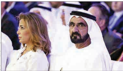
آل مکتوم و همسرش

تمامیت ارضی کشور خلاصه می‌شد. مواجعه دوی و ابوظبی ۴۸ سال از تشکیل امارات متحده عربی می‌گذرد و این کشور منهای توفیقات اقتصادی که در سایه فروش نفت حاصل شده است، هرگز نتوانسته سیاستی در شأن یک کشور مستقل را در پیش بگیرد. این دنباله‌روی و گوش بفرمانی سیاسی خصوصاً حالا که امارات نقش یک پادوی وفادار را برای عربستان سعودی بازی می‌کند بیشتر به چشم می‌آید. این میان پخش شایعاتی مبنی بر بروز اختلاف بین حاکم دوی و ولیعهد ابوظبی که به دلیل بیماری حاکم امارت عملاً اختیار استفاده از ارتش و منابع مالی کشور را در دست گرفته است، نشان از وجود بحران در این امیرنشین ثروتمند اما وابسته دارد. این که محمد بن راشد آل مکتوم حاکم دوی تا کجا می‌تواند در برابر بلندپروازی‌های محمد بن زاید دوام آورده و در مسأله جنگ یمن، محاصره قطر و دشمنی با ایران از او پیروی کند نکته‌ای است که در آینده مشخص خواهد شد. هر چند مثل روز روشن است که آل مکتوم در صورت ادامه اختلاف باید بهایی حتی بیش از ماجرای خیانت و فرار همسرش به انگلستان پرداخت کند.