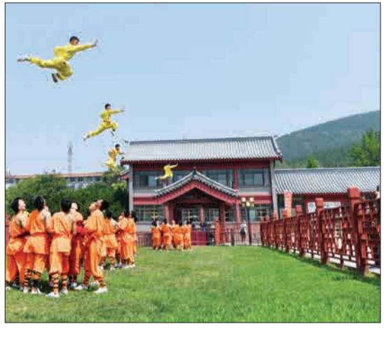
هنان، چین - هنرمندان جوان رزمی کار در معبد سونگ در حال تمرین هستند.