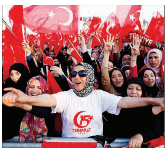
استانبول، ترکیه - طرفداران رجب طیب اردوغان، رئیس‌جمهوری ترکیه در سومین سالگرد شکست کودتای ارتش در این کشور جشن می‌گیرند.