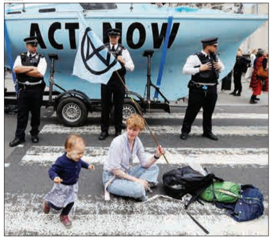
لندن، انگلیس - یکی از فعالان محیط زیست بیرون از دادگاه سلطنتی روی زمین نشست است.