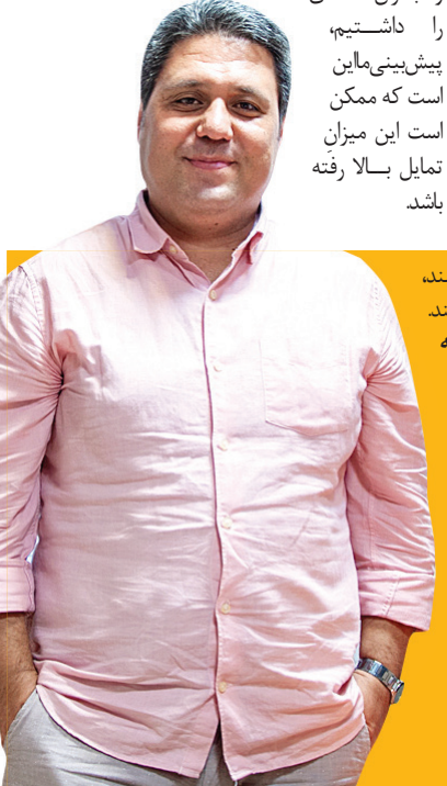
تکمیل تصمیم اقتصادی / شهروند

بله؛ ما در صدخانه مهاجرت هم می خواهیم نگاه غیر کارشناسی و جهت دار به پدیده مهاجرت را از حالت دو قطبی (صفر و صدی) خارج کنیم. مهاجرت یک پدیده خاکستری است نه سیاه یا سفید. به هر حال در دنیا هم تکانه های اقتصادی تأثیر ات اجتماعی دارد. ما بر اساس داده سال ۹۵ می دانیم که ۲۹،۸ درصد جمعیت تمایل به زندگی در کشور دیگری دارند، از سال ۹۵ تا کنون سه سال می گذرد و ما بحران اقتصادی