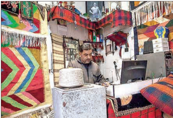
مدیرکل میراث فرهنگی، صنایع دستی و گردشگری استان کرمانشاه از ثبت ملی شهر هرسین به‌عنوان شهر ملی گلیم‌خیز داد. با ثبت ملی هر سنین به‌عنوان شهر ملی گلیم‌شاهد از تقای جیگانه این هنرخواهی بود.