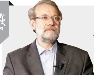
علی لاریجانی: ظریف، مسیر غلط آمریکا را افشا کرد

علی لاریجانی، رئیس مجلس، گفت: «ظریف به دلیل نقش زیادی که در افزایش مسیر غلط آمریکا داشت، تحریم شد و ما باید با حربه‌های دشمن مقابله کنیم و اصحاب رسانه هم در این زمینه مسئول هستند. رسانه‌ها به جای مایوس کردن مردم و آرایه گزارش‌های منفی، باید نکات مثبت را به مردم بگویند. برای مثال باید دولت و مجلس را واقف کنند که از توانمندی‌های وظرفیت‌های مختلف اقتصادی کشور استفاده کنند، چرا که بسیاری از ظرفیت‌های بالقوه ما بالفعل نشده است و متأسفانه واردات در بخشی از جاهای بسیار زیاد است.»