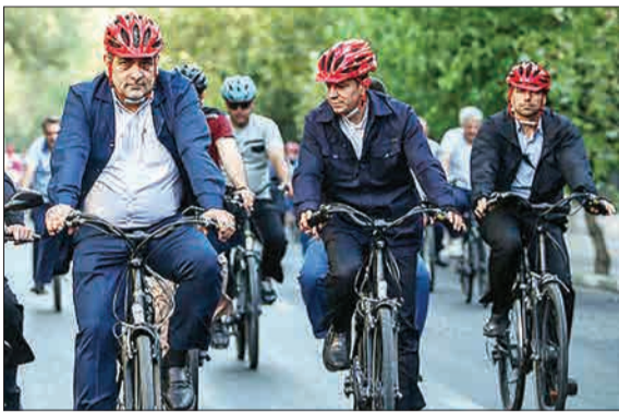
روز گذشته به مناسبت روز خبرنگار، اصحاب رسانه هم‌راه با شهردار تهران، مسیر میدان توحید تا خیابان انقلاب را به وسیله دوچرخه رکاب زدند. در انتهای این مراسم نشست هم‌اندیشی بین مدیران رسانه‌ها و شهردار تهران برگزار شد. (ایستا)