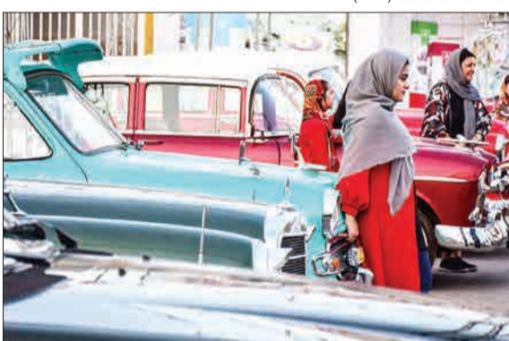
دوره‌های خودروهای کلاسیک در کرمان (مشرق)