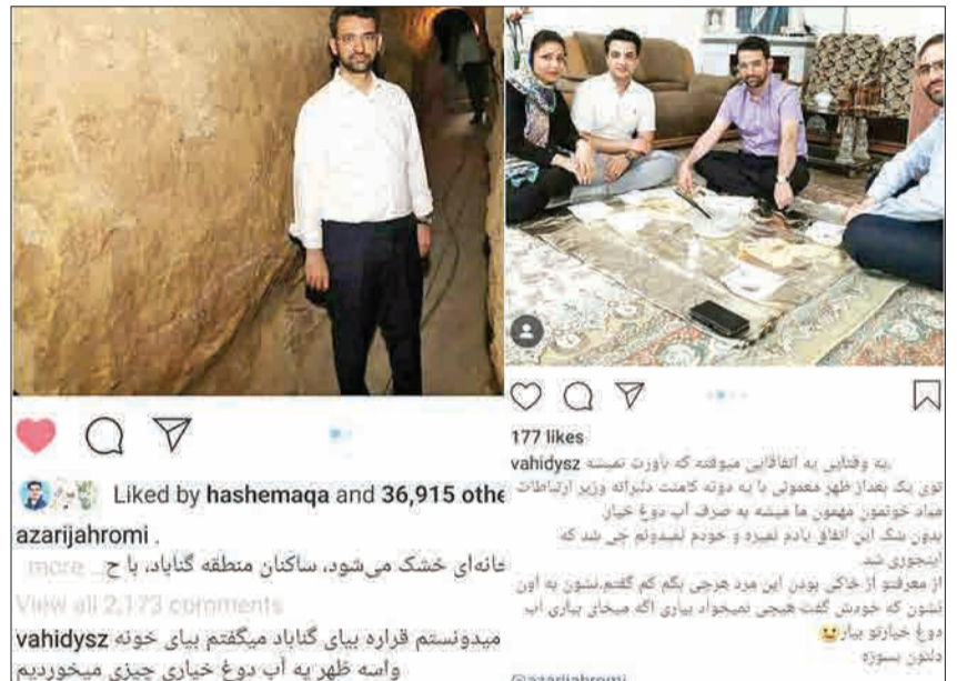
177 likes vahidysz یه وقتی به اتفاقاً بنه موفقه که باورت تمسه تو یه یگ بعد از ظهر معمولی ما به دونه کانت دلواکه وزیر ارتباطات فواد خوتونو میهنو ما همه به صرف آب دوغ خیار بدون شک این اتفاق یادم نمیره و خودم لیدونم چی شد که اینجوری شد از مرفونو از خکی بودن این مید جزی بکم کم گفتم ننون به اون ننون که خوش گفتم هیچ نمیداد بیاری اگه میخای بیاری آب دوغ خیارو بیاری دلون بسوزه

فعالیت محمدجواد آذری جهرمی یا همان وزیر جوان در شبکه‌های اجتماعی موضوع تازه‌ای نیست و او بارها با واکنش‌هایی که به کامنت‌ها نشان داده و با جنس بست‌هایی که گذاشته همه را غافلگیر کرده است اما این بار غافلگیری او از جنس دیگری بود و اتفاق تازه‌ای را رو کرد. از آنجا که آقای وزیر خودش سر شوخی و خودمانی بازی را با خیلی از دنبال‌کننده‌هایش در شبکه‌های مجازی از اینستاگرام گرفته تا توئیتر باز کرده است دیدن کامنت‌های شوخ‌طبعانه زیر بست‌های او چندان عجیب نیست، این بار هم وقتی او در گناباد بود و تصویری از حضورش در یکی از قنات‌های این شهر منتشر کرد و آخرش هم نوشت «خدایی گرمه حاجی»، یکی از مخاطب‌ها برایش کامنت گذاشت: «می‌دونستم قراره بیای گناباد می‌گفتم بیای خونه واسه ظهیر به آبدوغ خیار چی بخوریم». کامنتی که چندان عجیب نیست اما پای وزیر ارتباطات را به خانه این جوان گنابادی باز کرد. وحید یوسف‌زاده که میزبان وزیر جوان بوده آن هم به صرف آبدوغ خیار درباره این ماجرا به «شهروند» توضیح داده است.