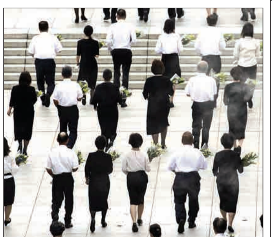
ژاپن - هفتاد و چهارمین سالگرد پرتاب بمب اتمی در جنگ جهانی دوم با یک دقیقه سکوت برگزار شد.