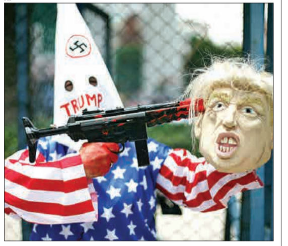
مکزیک - یک فعال حقوق بشری پس از تیراندازی در تگزاس و کشته شدن چند مکزیک‌ها، ماسکی از چهره دونالد ترامپ را در دست گرفته است.