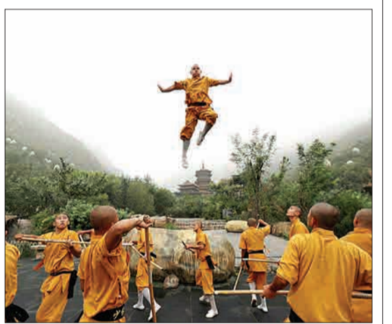
چین - راهبان معبد شائولین در حال تمرین کونگ فو هستند.