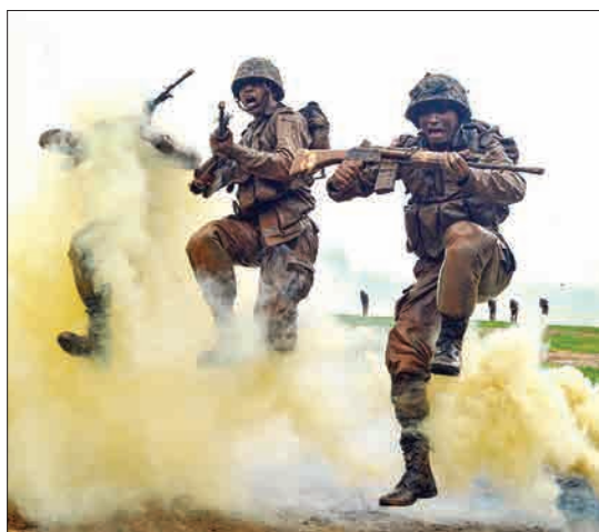
جبالپور، هند - نیروهای ارتش در حال تمرین هستند.