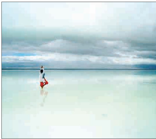
هایچی، چین - زنی در میان دریاچه نمک در حال مراقبه است.