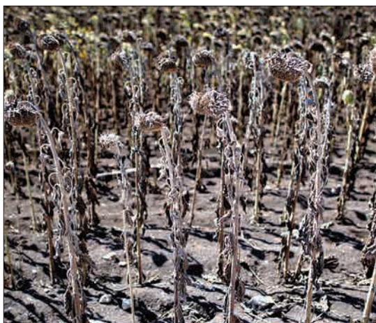
ازرت، بلغارستان - گل‌های آفتابگردانی که به دلیل گرمای شدید هوا، خشک شده‌اند. هفته بعد دمای هوادر بخش‌هایی از این کشور به ۴۱ درجه سانتیگراد می‌رسد.