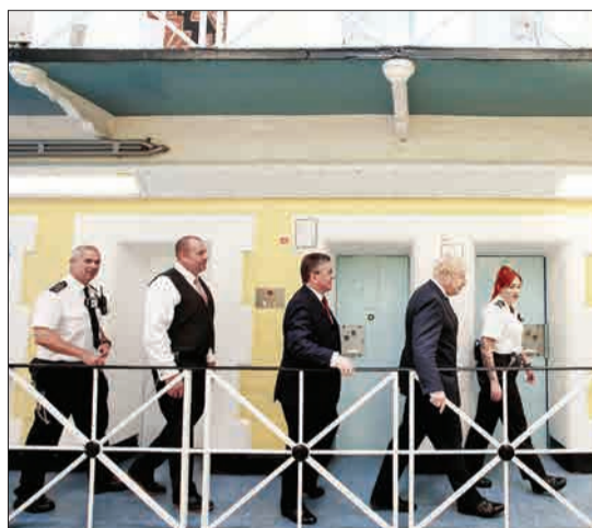
لیدز، انگلیس - دیدار بوریس جانسون، نخست‌وزیر بریتانیا از زندان لیدز