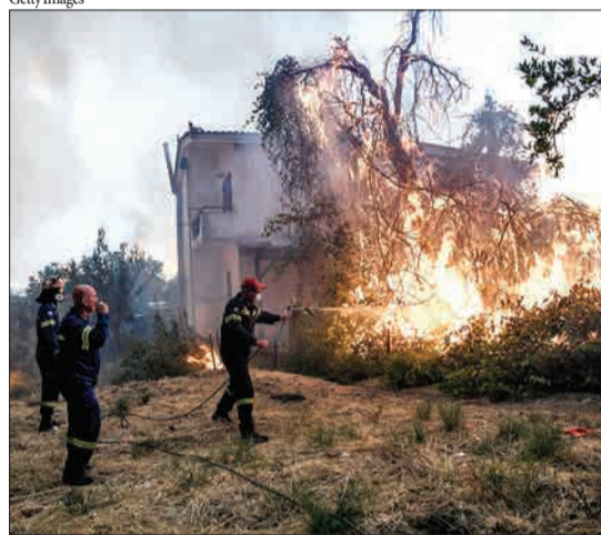
ایویا، یونان - آتش‌نشنان در حال خاموش کردن آتش در نزدیکی روستای کونتوسباتی هستند.