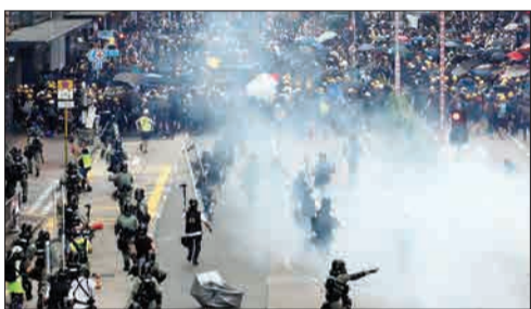
تصمیم معترضان در فرودگاه هنگ کنگ

داشتن نیروهای ضد چینی و استقلال طلب در نارامی‌های اخیر را مقرون به واقعیت کرده است. از سال ۱۹۹۷ که چین پس از گذشت یک قرن و نیم، هنگ کنگ را از بریتانیا پس گرفت، این سرزمین بر اساس قانون یک کشور و دو سیستم اداره می‌شود، اما همین نیز به مذاق بسیاری از اهالی آن که خود را از هر لحاظی نیاز از چین می‌دانند، خوش نمی‌آید. این میان، شاید بدترین