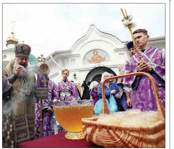
یک تریکاتور نیبورگ، روسیه - کشیش ارتدوکس روسی در جشن خوردن عسل شرکت می کند