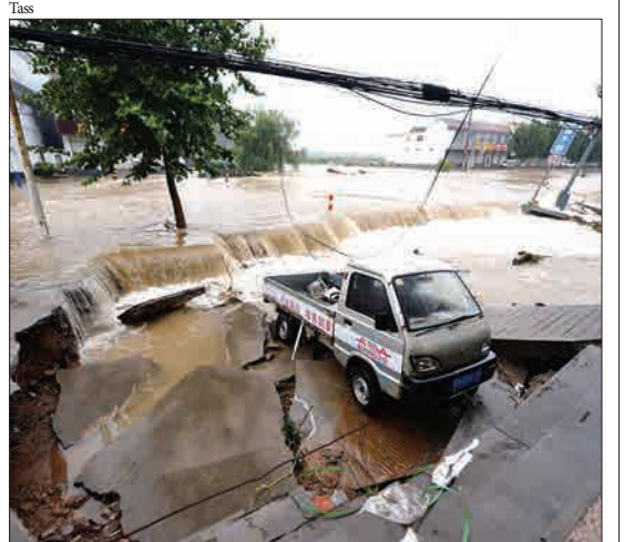
جینان، چین - سیل ناشی از طوفان لکیما، ماشینی را با خود می برد. این نهمین طوفان سال جاری در چین است.