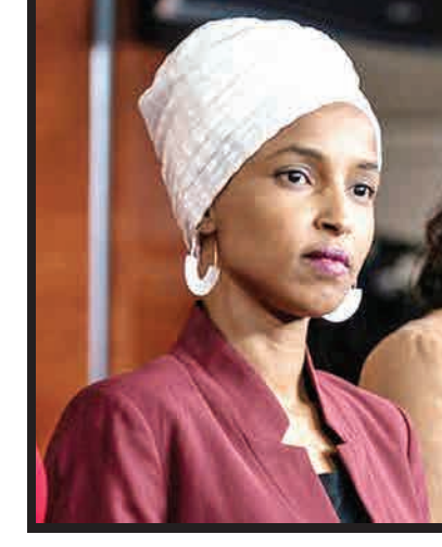
یکی از نمایندگان کنگره آمریکا که در جریان سفر به فلسطین اشغالی با ترامپ درگیر شد.

این دو نماینده مسلمان جزو گروه معروف موسوم به «جوخه» بودند که ترامپ به آنها اعلام کرد بهتر است به خانه های خود برگردند. منظور ترامپ این بود که این نمایندگان بهتر است به کشورهای اصلی خود بازگردند. این چهار نفر اصلیتی غیر آمریکایی دارند و سال ها پیش به آمریکا مهاجرت کرده اند. حالا معلوم شده رژیم صهیونیستی به توصیه ترامپ درخواست ویزای این دو نماینده کنگره را رد کرده است. این دو نماینده دموکرات تصمیم داشتند به تل آویو و قدس سفر کرده و از مسجد الاقصی هم بازدید کنند. روزنامه عبری زبان بدبوعوت آحارونوت هم در این باره نوشت که رژیم صهیونیستی به خاطر این که طلیب و عمر جدول برنامه های خود در جریان سفر به فلسطین اشغالی را با این رژیم هماهنگ نکرده اند، تصمیم دارد مانع از انجام این سفر شود. وزارت امور خارجه رژیم صهیونیستی نیز اعلام کرد که هنوز تصمیم نهایی در مورد سفر این دو نماینده دموکرات به فلسطین اشغالی اتخاذ نشده است. اما خبرها حاکی از آن است که تل آویو به توصیه ترامپ در خواست ویزای این دو نماینده کنگره وارد کرده است.