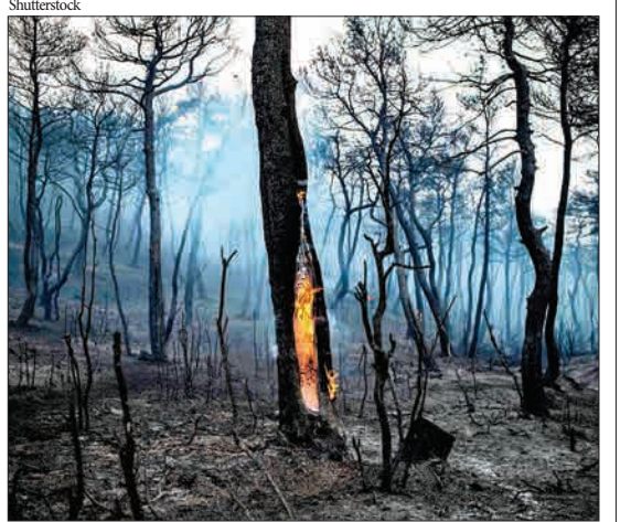
ماکریمالی، یونان - تنه یک درخت، هنوز در آتش می سوزد. آتش نشانان نتوانستند آتش سوزی جزیره یایوایادر شمال شرق آتن رامهار کنند.