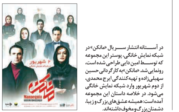
در آستانه انتشار سریال «مانکن» در شبکه نمایش خانگی، پوستر این مجموعه که توسط امین دایی طراحی شده است، رونمایی شد. «مانکن» به کارگردانی حسین سهیلی زاده و تهیه کنندگی ایرج محمدی، از دوم شهریور وارد شبکه نمایش خانگی می شود. در خلاصه داستان این مجموعه آمده است: همیشه عشق های بزرگ و زیبا، دشمنان بزرگ و مخوف داشته اند.