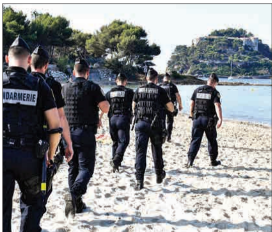
فرانسسه - نیروهای امنیتی در ساحل، در نزدیکی محل استراحت تابستانی رئیس جمهوری در سواحل مدیترانه مشغول گشتزنی هستند.