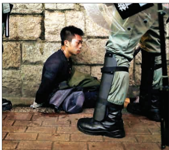
هنگ کنگ - پلیس ضد شورش یک معترض را بازداشت کرده است.