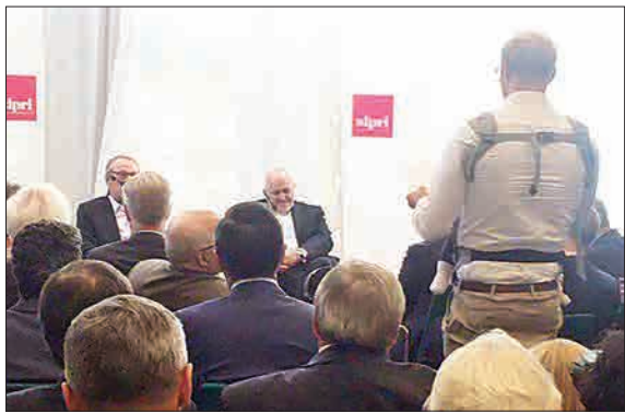
تصویری جالب از نماینده پارلمان سوئد در حال سوال از ظریف، که فرزند خود را در بغل دارد. (جام جم)