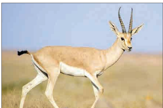
تازترین تصویر از چپیر، غزال دشت های گرم و بی آب ایران، که در پارک ملی کویر گرمسار به ثبت رسیده است.