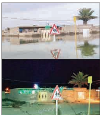
عکس بالا خانه ای از روستای شاکریه سوسنگرد در محاصره سیل فروردین ۹۸ و عکس پایین برپایی مراسم عروسی در همان خانه در مرداد ۹۸. (مشرق)