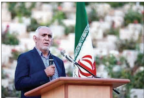
سید علی ملک حسینی، پدر پیوند کبد ایران، در جشن ۱۰ هزارمین پیوند عضو در شیراز، این موفقیت را در کنار فعالیت های مرکز خیریه، پیوند اعضای بوعلی سینا و انجام بیشترین پیوند کبد در دنیا، تلافی دورویای بزرگ خواند. (ایلتا)