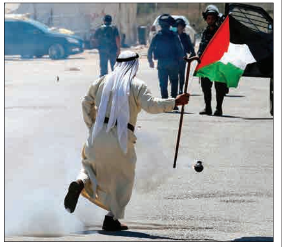
کرانه غربی، فلسطین - مرد فلسطینی در جریان تظاهرات سعی می‌کند از گلوله گاز اشک‌آور فاصله بگیرد