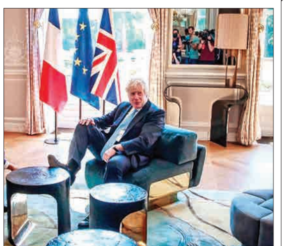
پاریس، فرانسه - بوریس جانسون در دیدار با امانوئل مکران یک لحظه پیش را روی میز عسلی گذاشت که حواشی بسیار به وجود آورد.