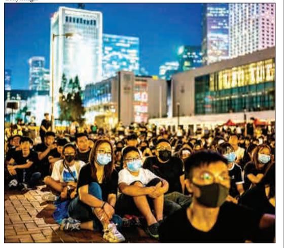
هنگ کنگ - تظاهرات کودکان مقطع راهنمایی در هنگ کنگ. لیدر این جریان اعلام کرده که تادو هفته پچه ها به مدرسه نروند.