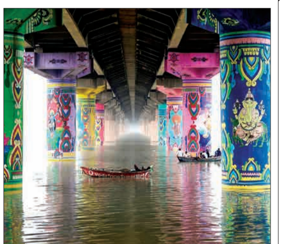
الله آباد، هند - مردی که بر روی یک قایق بر روی آب های سیلابی به دلیل بارش باران های شدید موسمی در حال استراحت است.