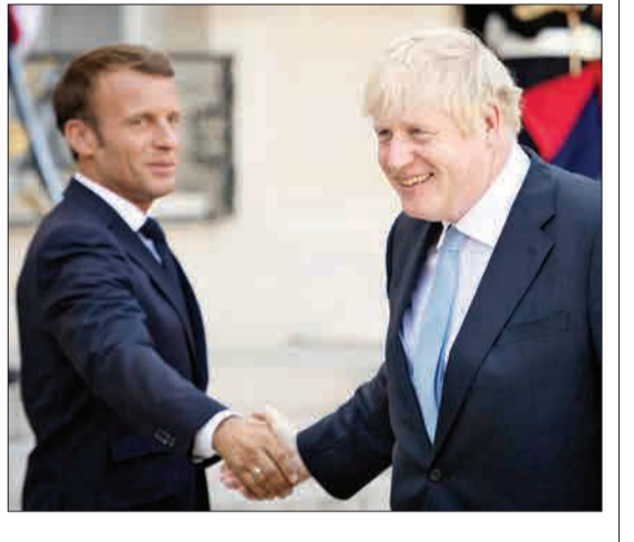
پاریس - دیدار بوریس جانسون نخست وزیر بریتانیا با اماتونل مکرون رئیس جمهور فرانسه آنها پس از گفت و گو در مورد بر گزیت خداحافظی می کنند.