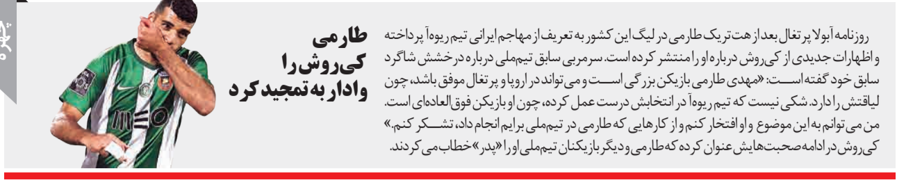
طارمی کی روش را وادار به تعجید کرد