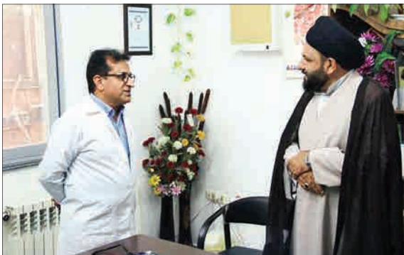
حجت‌الاسلام سلیمانی امام‌جمعه لنگرود در روز پزشک با حضور در مطب پزشکان برجسته این شهر، ضمن تقدیر از آنها جهت ویزیت رایگان بیماران کم‌درآمد، هماهنگی‌های لازم را به عمل آورد. (مشرق)