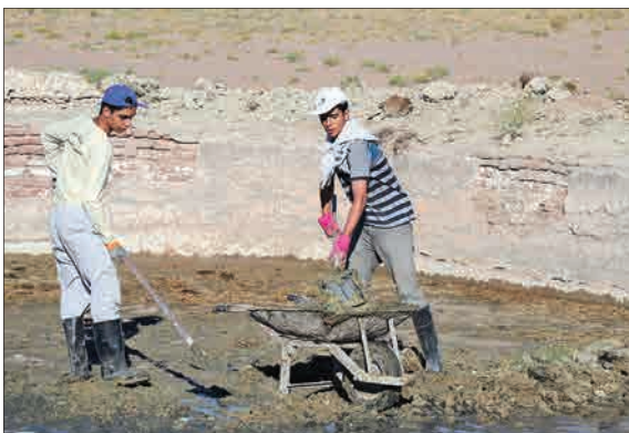
۴۰ نفر از دانشجویان دانشگاه خواجه نصیر طوسی به شکل جهادی به منطقه جلگه ماژان از شهرستان خوسف اعزام شدند و مشغول خدمت رسانی هستند. کانال کشی جوی آب مزراع به طول ۵۰ متر، احداث استخر ذخیره آب کشاورزی، احداث یک واحد کمپوستی برای خانواده‌های نیازمند و کمک به مرتودرشته فئات از خدمات این گروه جهادی به‌مهر دست‌های جلگه ماژان است. (مهر)