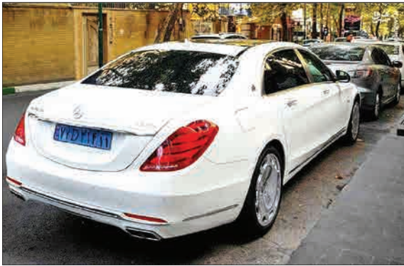
بنز اس ۶۰۰، زیرپای سفیر آلمان در تهران.