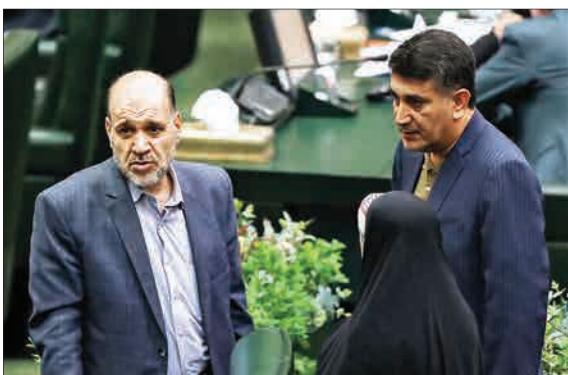
جلسه علنی مجلس شورای اسلامی، سوم شهریور ماه با حضور بیژن زنگنه، وزیر نفت و به ریاست علی لاریجانی برگزار شد. دو نماینده داداشتی که با قرار آذاشدند، در این جلسه حضور داشتند. (ایستا)