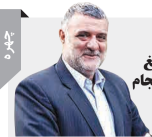
وزیر جهاد کشاورزی:

واکنش سریع هنگام وقوع زلزله می تواند شما را از جراحات احتمالی محافظت کند. حداقل دو بار در سال، پناه گیری را تمرین کنید.