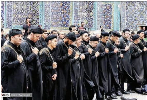
آیین سنتی طشت گذاری و عزاداری پیغمبر گرامان حسینی برای استقبال از ماه محرم در بقعه شیخ صفی الدین اردبیلی برگزار شد.