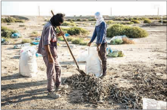
به رغم بارندگی های بسیار در ابتدای امسال که منجر به آبگیری و احیای مجدد تالاب بین المللی هامون در استان سیستان و بلوچستان شد، اما متأسفانه برداشت بی رویه آب باعث خشکی و مرگ و میر میلیون ها ماهی و تلف شدن موجودات آبی هامون شده است. (مشرق)