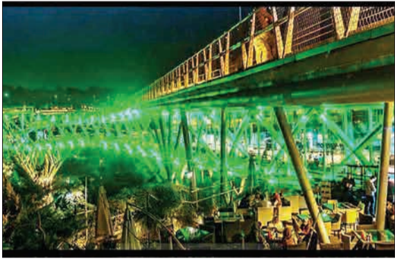
با شروع ماه محرم و ایام عزاداری سالار شهیدان حضرت اباعبدالله الحسین (ع) نورپردازی پیل طبیعت اول ماه مهر رنگ سبز تغییر پیدا کرد.