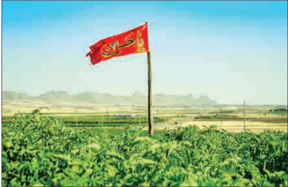
مردم شهرستان خدابنده از توابع استان زنجان معتقدند برای برکت و کسب رزق و روزی بیشتر و رسیدن به محصولات خوب و پرثمر، بایستی بیرق و پرچم متبرک کبیر نام سید و سالار شهیدان حضرت اباعبدالله الحسین (ع) و جانباز دشت کربلا حضرت ابوالفضل العباس (ع) را در میانه زمین زراعی بر افراشته کنند. (باشگاه خبرنگاران جوان)