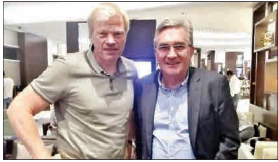
برانکو پوانکوویچ، سرمربی تیم فوتبال الاهلی عربستان در فرودگاه ابوظبی با اولیور کان دروازه‌بان پیشین تیم ملی فوتبال آلمان دیدار کرد.