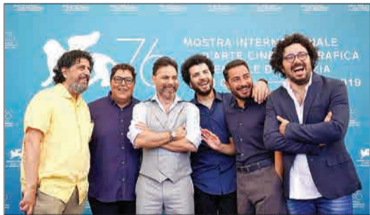
این نخستین تصویر منتشرشده از عوامل فیلم «متری شیش و نیم» است که در مراسم فوتو کال فیلم در فستیوال فیلم ونیز انجام شد.