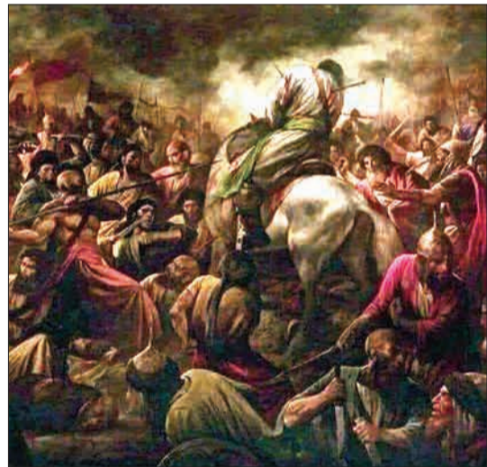
دیوانچی بسکوال، نقاش معروف ایتالیایی که واقعه عاشورا را در عالم رو یا دیده و از آن متأثر شده است، این صحنه را در طول ۶ ماه به تصویر کشید.