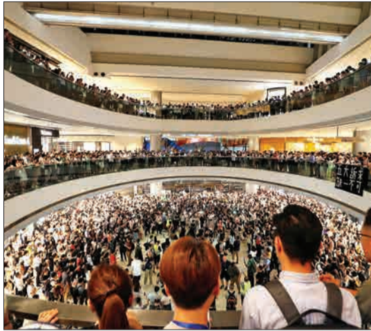
هنگ کنگ - معترضان در مرکز اقتصاد بین المللی تجمع کرده اند.