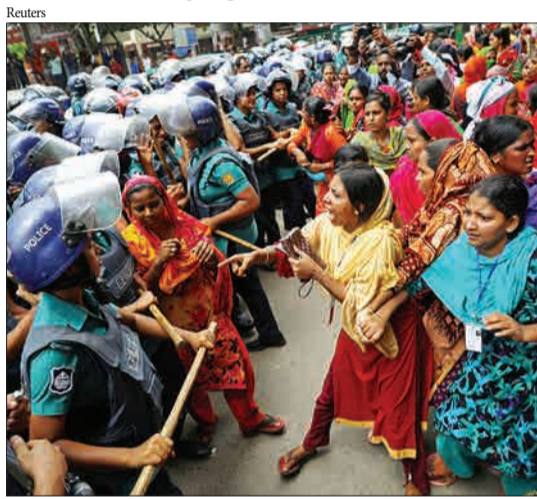
داکا، بنگلادش - کارگرانی که به خاطر عدم پرداخت دستمزدهایشان با پلیس درگیر شده اند.