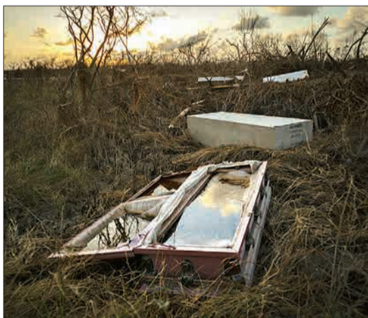
باهاماس - تابوتی که پس از طوفان دریا و بارش شدید باران، بر آب شده است.