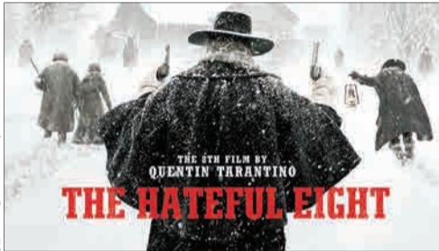
هیجیت نظر است