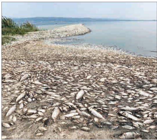
یونان - هزاران ماهی دریاچه کورنیا به دلیل خشکسالی و عدم رسیدن مواد غذایی، جان خود را از دست داده‌اند.