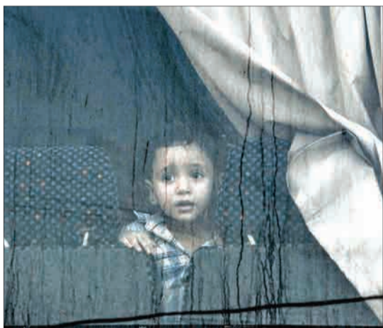
آتن، یونان - پسر بچه مهاجری که پلیس او را به راه‌دو گاه دیگری منتقل می‌کند.