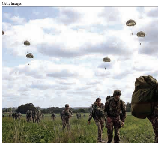
هلند - چتربازانی که در یک رژه از هواپیما به پایین می‌پرند.