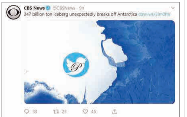
سه سی اس نیوز با انتشار تصویری خبر از جدا شدن غیرمنتظره ۳۴۷ میلیارد تن کوه یخ از قطب جنوب داده است. تصویری که گفتن از تغییرات اقلیمی را در شبکه های اجتماعی دوبار مداع کرد.