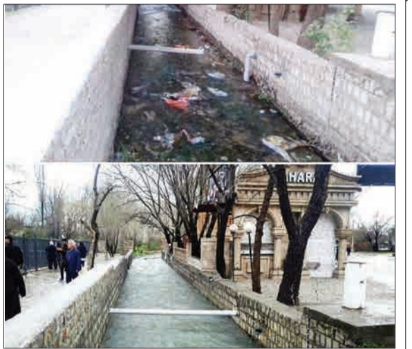
انتشار دو تصویر از محوه طاق بستان کرمانشاه که یکی متعلق به فروردین و دیگری مهر ماه امسال است. از سوی بسیاری از کاربران شبکه های اجتماعی باز نشر شد، آن هم به دلیل رعایت نکردن نظافت محیط و تبدیل رودخانه جویین از زباله.