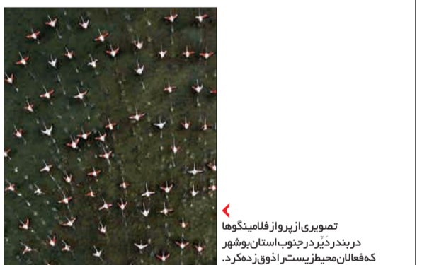
تصویری از پرواز قلمبینه گوها در بندر دزیر جنوب استان بوشهر که فعالان محیط زیست از ذوق زدند.