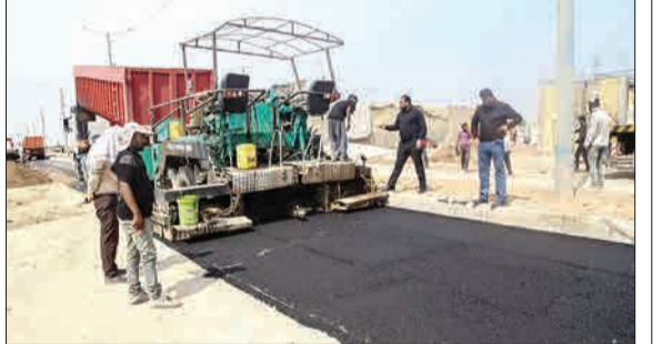
مرز چاباه، ۱۵ روز مانده به اربعین برای پذیرایی از زائران عبوری آماده شده است.