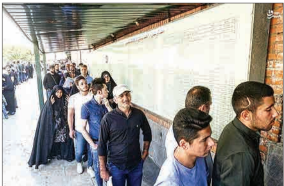
اداره گذرنامه این روزها در آستانه سفر اربعین حسینی شلوغ است. (مشرق)