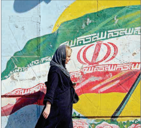
تصویری که خبرگزاری فرانسه از تهران روی خروجی گذاشت و مورد توجه کاربران شبکه های اجتماعی قرار گرفت.