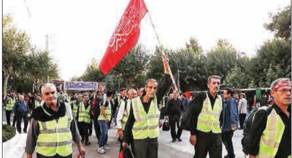
۱۴۰۰ داوطلب شهرداری تهران، برای خدمت رسانی در مراسم پیاده روی اربعین و استقرار آنها در شهرهای نجف، کربلا و کوفه اعزام شدند.