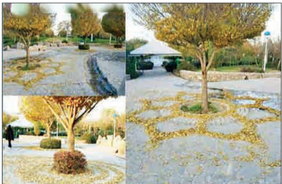
کار فکشنگیک پاکبان خوش ذوق مشهدی در آستانه فصل پاییز.