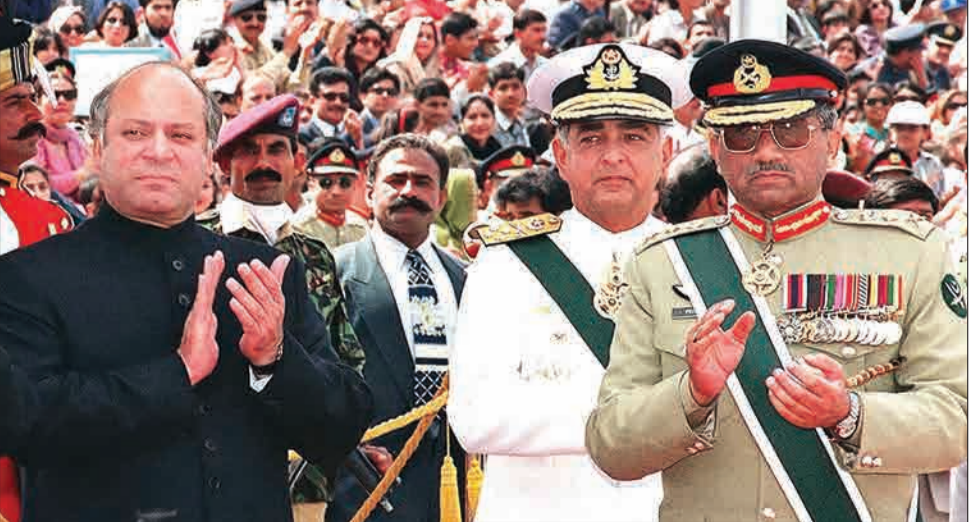
ژنرال مشرف و یوزاف شریف - ۱۹۹۹

تجربه کودتا، فقط یک دهه بعد از استقلال پاکستانی‌ها دقیقاً ۱۱ سال بعد از استقلال و تشکیل یک کشور مستقل با پدیده کودتا مواجه شدند. آن جایی که ژنرال ایوب خان فرمانده کل ارتش این کشور اسکندر میرزا رئیس‌جمهوری و فیروز خان نخست‌وزیر از قدرت برکنار کرد و خود مقدرات پاکستان را در دست گرفت. کودتای ژنرال ایوب خان را باید در دهه کودتاهای بدون خونریزی قرار داد. هر چند بعدها پاکستانی‌ها مایل سخت‌تری از آن رانیز تجربه کردند. در سال ۱۹۷۷ پس از چند سالی که به نظر می‌رسید نظامیان از قدرت کوتاه شده و آنها مشغول عمل به وظایف خود در دفاع از مرزها هستند، ژنرال محمد ضیا الحق طی یک کودتای نظامی دولت