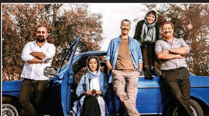
عوامل فیلم سینمایی «سگ پند» با انتشار تصویری از آغاز فیلمبرداری این فیلم خیر دادند. این فیلم دومین تجربه کارگردانی مهرا ن احمدی است.