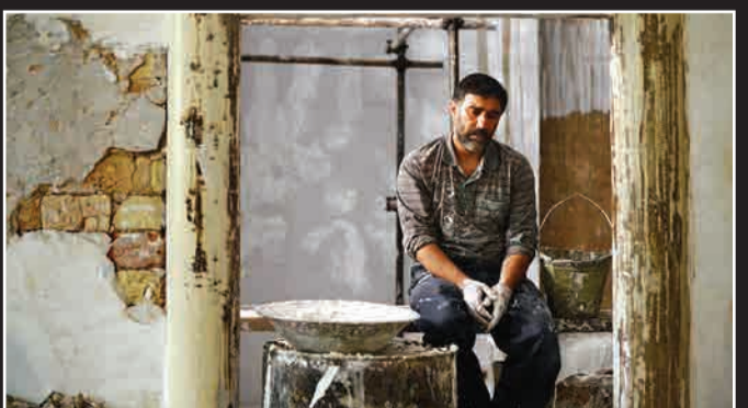
نخستین تصویری از بازی محسن تنابنده در فیلم «عنکبوت» به کارگردانی ایرا هیم ایرچزاد منتشر شد. تنابنده قرار است نقش آدمکش معروف را که مشهور به مرد عنکبوتی است، ایفا کند.