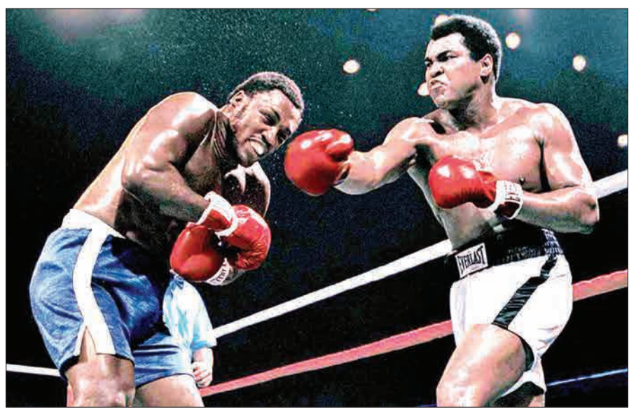
مبارزه محمد علی و جو فریزر در مانیل - ۱۹۷۵

۷۶ سال پیش در چنین روزی، برابر دوازدهم ژانویه ۱۹۴۴ میلادی، پرسی در بوو فورت ایالت کارولینای جنوبی به دنیا آمد که نزدیک به سده بعد به یکی از مشاهیر این ایالت تبدیل شد. جو فریزر ۲۱ سال بیشتر نداشت که درخشش در صحنه مسابقات بوکس را آغاز کرد، اما جهانی شدن نام او به واقع پس از تلاقی اش با یکی از بزرگ‌ترین قهرمانان بوکس سنگین‌وزن یعنی کاسیوس مارسولوس کلی که بعد از اسلام آوردن نام محمدعلی را برای خود برگزیده بود، رقم خورد. این مهم نخستین بار در سال ۱۹۷۱ میلادی و پس از بازگشت مجدد محمدعلی به صحنه بوکس اتفاق افتاد. در این ایام شهرت