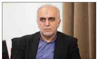
قول وزیر اقتصاد: دولت از سیستم بانکی استقراض نمی‌کند

وزیر اقتصاد اعلام کرد: «دولت تا امروز حتی یک ریال از سیستم بانکی برای تأمین مالی بودجه عمومی استقراض نکرده است.» فرهاد دژپسند روز گذشته در نشست خبری با خبرنگاران، اظهار داشت: «تا به امروز برای پرداخت وجوه اوراق حتی یک ساعت هم تأخیر نداشته‌ایم و به هنگام تأمین مالی اوراق صورت گرفته است.» او در بخش دیگری از این نشست گفت: «اگر بخواهیم نفت از بودجه خارج شود باید درآمدهای جایگزین داشته باشیم که درآمدهای مالیاتی به خصوص مالیات‌های مستقیم اهمیت ویژه پیدا می‌کند.» وزیر اقتصاد افزود: «امروز درآمدهای مالیاتی توانست بخش بزرگی از درآمدهای نفتی را برای دولت محقق کند که در شرایط فعلی دستاورد بزرگی را شکل داده است.» دژپسند اعلام کرد: «البته سایه سنگین نفت در اقتصاد هم وجود دارد. افزایش صادرات غیرنفتی به یک هدف تبدیل شد. در ۱۰ ماهه نخست سال ۹۸ نسبت به سال گذشته صادرات غیرنفتی حدود ۳ درصد از نظر ارزش کاهش و وزنی ۲۰ درصد افزایش داشته است.» او تصریح کرد: «راه دیگر سرمایه‌گذاری خارجی است که باید از شیوه‌های متنوع آنها را به اقتصاد ایران تزریق کنیم.» وزیر اقتصاد افزود: «آخرین آمار سرمایه‌گذاری خارجی ثبت شده نشان می‌دهد ۵۰ درصد (۴۰۵ میلیارد دلار) سرمایه‌گذاری خارجی نسبت به سال گذشته در ایران رشد داشته است.» دژپسند همچنین اعلام کرد: «بانک‌ها پارسال ۷۰۰ هزار میلیارد تومان تسهیلات ارائه کرده‌اند و در هشت ماه نخست سال جاری نیز تمرکز برای سرمایه در گردش بوده است. بانک‌ها درک کرده‌اند که اگر سرمایه در گردش افزایش پیدا کند، می‌تواند ثمرات بهینه‌ای داشته باشد.»