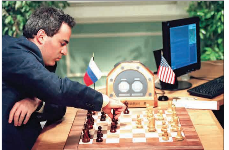
کاسپاروف در مصاف با دیپ بلو-۱۹۹۶

۲۴ سال پیش در چنین روزی، برابر دهم فوریه ۱۹۹۶ میلادی، گری کاسپاروف، قهرمان شطرنج جهان در مصاف با «دیپ بلو» کامپیوتر ساخته شرکت IBM، نخستین شکست خود را تجربه کرد. این مسابقه بزرگ در نهایت با نتیجه ۴ بر ۲ به نفع نابغه اهل روسیه به پایان رسید. اما سال بعد دیپ بلو موفق شد کاسپاروف را با نتیجه ۵/۳ بر ۵/۲ شکست دهد. نرم افزار دیپ بلو در سال ۱۹۹۷ توانایی محاسبه ۳۰ میلیون وضع در هر ثانیه داشت. □