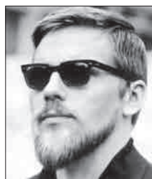
هانس گئورگ راج

هانس گئورگ راج (Hans-Georg Rauch, ۱۹۳۹-۱۹۹۳) طراح و گرافیست آلمانی در شهر برلین متولد شد. «راج» فارغ التحصیل دانشکده هنرهای زیبای هامبورگ است. آثار او از سال ۱۹۶۵ در مطبوعات آلمان و سایر کشورهای جهان از جمله اسپیکل، اشترن، لوک و نیویورک تایمز به چاپ رسیده است. این هنرمند سال ۱۹۷۰ جایزه «هنریک زیل» را با خلق آثار اجتماعی و انتقادی کسب کرد. بیشتر آثار او بر مبنای تکرار خطوط درهم پیچیده بنا شده و دارای ساختاری عظیم و استوار است. دقت در جزئیات و حساسیت در ریزه کاری ها از ویژگی های هنری او است و چنین وسواسی راد کمتر هنرمندی می توان سراغ گرفت. او توجه هوشمندانه ای میان انتخاب سوژه و سپس نحوه پیاده سازی آن دارد که از عمق و هماهنگی بسیاری برخوردار است. سال ۱۹۸۱ موزه «ویلیم بوش» در شهر «هاننور» مروری بر آثار او را به نمایش گذاشت که پس از آن به ترتیب در بسیاری از کشورهای دیگر از جمله آمریکا، هلند، بلژیک، کانادا و چین نیز در معرض دید علاقه مندان قرار گرفت. از آثار او چندین کتاب به چاپ رسیده که از میان آنها می توان به مجموعه «Heitere Cartoons» اشاره کرد. «راج» در کنار فعالیت های هنری به جنبش های صلح طلبانه علاقه مند بود و آثار با ارزشی در این زمینه منتشر کرده است.