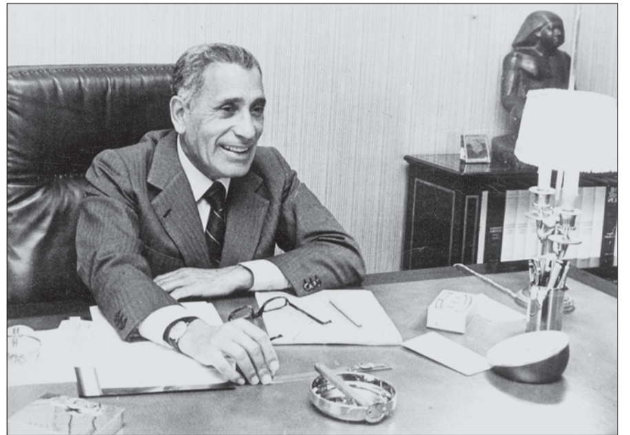
محمد حسنین هیگل در دفتر روزنامه الاهرام- ۱۹۷۵

چهار سال پیش در چنین روزی، برابر هفدهم فوریه ۱۹۷۵ میلادی، محمد حسنین هیگل، روزنامه‌نگار مشهور مصری در قاهره درگذشت. هیگل را باید مشهورترین روزنامه‌نگار عرب از ابتدا تا کنون به‌شمار آورد که با مدیریت خود روزنامه «الاهرام» چاپ مصر را به تأثیرگذارترین رسانه جهان عرب در دهه‌های ۵۰ و ۶۰ میلادی تبدیل کرد. هیگل برای سال‌ها به‌عنوان خبرنگار الاهرام در ایران حضور داشت و گزارش‌های داغ‌آز و مبارزات مردم ایران برای ملی کردن صنعت نفت، جمال عبدالناصر را به فکر ملی کردن کانال سوئز انداخت. □