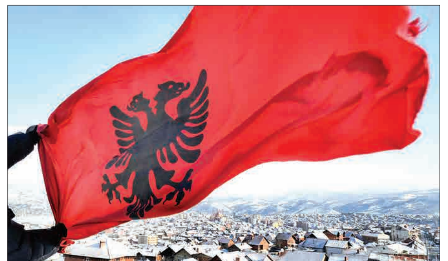
منابع: قطار سریع‌السیر یوگسلاوی؛ نشر مروریاد و چگونگی فروپاشی یوگسلاوی؛ نشر اطلاعات

بسیاری تجزیه یوگسلاوی را از جمله تبعات انحلال اتحاد جماهیر شوروی در ابتدای دهه ۹۰ میلادی ارزیابی می‌کنند، اما به‌زعم آنها یکی که به مسائل منطقه بالکان آگاه‌ترند ناقوس فروپاشی این کشور دقیقاً از فردای مرگ «یوسیپ بروز تیتو» (از رهبران مقاومت مردمی - گروه‌های پارتیزانی- در برابر اشغالگری آلمان نازی و رئیس‌جمهوری مادام‌العمر یوگسلاوی) در ماه می ۱۹۸۰ میلادی به‌صدا درآمد. تیتو را شاید بتوان به‌نخ تسبیح منطقه بلاخیز بالکان که از زمان سطره امپراتوری عثمانی لقب دیگ جوشان اروپا را بدید می‌کشید تشبیه کرد؛ زیرا توانسته بود اقوام و مذاهب مختلف را در جغرافیایی واحد به نام یوگسلاوی گرد هم آورده و آنها را رهبری کند. او یوگسلاوی را بر خرابی‌های امپراتوری صربستان بنا کرد و با اینکه خود تباری کروات داشت اما سابقه‌اش