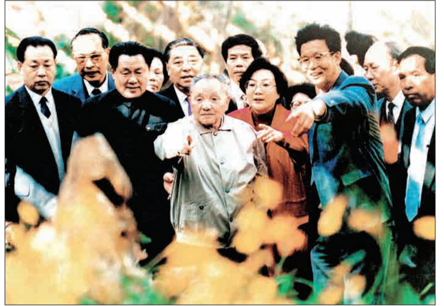
دنگ شیائوپینگ در سفر دوره‌ای به جنوب چین - ۱۹۹۲

۲۳ سال پیش در چنین روزی، برابر نوزدهم فوریه ۱۹۹۲ میلادی، دنگ شیائوپینگ، سیاستمدار شهیر چینی در ۹۲ سالگی درگذشت. سیاست‌های درهای باز و اصلاحات اقتصادی در چین را باید مولود شیائوپینگ به شمار آورد که با آغاز سیادت او بر حزب کمونیست این کشور رخ نمود. دنگ شیائوپینگ سیاست «ایدئولوژی در رأس» ماورا با «اقتصاد در رأس» عوض کرد و با این کار خود چین را در مسیر چیزی که اکنون به آن مبدل شده است، قرار داد.