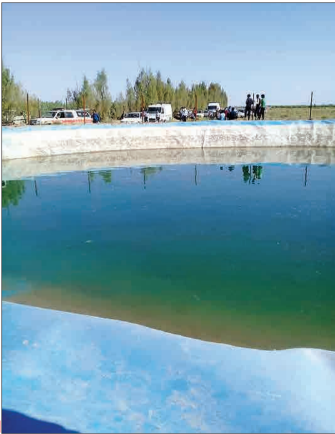
محل حادثه، شهرود

حدود ۱٫۵ تا ۲ متر است که عمق زیادی نیست. اما خطر اصلی این حوضچه‌ها جنس پلیمری و شکل هندسی آنهاست که خارج شدن از آن را عملاً غیرممکن می‌کند: «این استخرها برای جمع‌آوری روان‌آب‌ها و ذخیره کردن آب باران ایجاد شده. کناره‌های این استخرها انحناء دارد و سطح آنها هم در صورت خیس شدن، کاملاً لغزنده می‌شود و عملاً امکان خارج شدن از استخر وجود ندارد.»