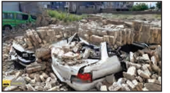
ریزش دیوار قدیمی در شهرری چند خودرو را دفن کرد

«چند سالی است که با زیاد شدن این استخرها این اتفاقات هم بیشتر شده. به خصوص در بهار و پاییز که بارندگی زیاد است، آب بیشتر هم جمع می‌شود و این بچه‌های بی‌گناه جان‌شان را از دست می‌دهند.» استخرهای پلیمری برای کمک به پسته‌کاران ساخته شد. کرمان سال‌هاست که با خشکسالی دست به گریبان است، به همین علت باغداران برای ذخیره آب این استخرها را ایجاد کردند. اما هرچقدر ساخت آنها به تولید بیشتر پسته و کشاورزی و باغداری رونق بخشید، خانواده‌های زیادی را هم داغدار کرد.