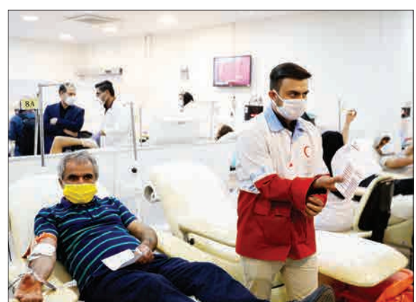
وحد خدادادی / آتا

همزمان با دومین شب احیا در ماه مبارک رمضان و با توجه به کاهش ذخیره بانک خون سازمان انتقال خون به دلیل شیوع ویروس کرونا، بیش از ۵۰ عضو داوطلب و جوان هلال احمر منطقه ۱۱ شهر تهران در طرح قرار مهربانی برای اهدای خون شرکت کردند.