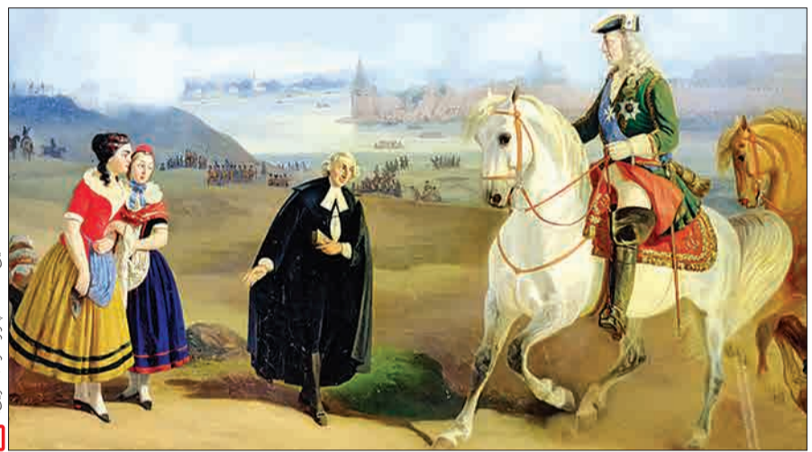
تختین ملاقات پتر و مارتا (کاترین)