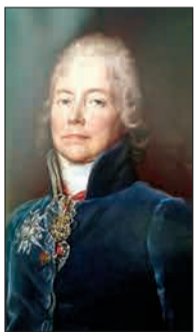
صدو هشتاد و دو سال پیش در چنین روزی، برابر هفدهم می ۱۸۳۸ میلادی، شارل موریس دو تالیبران، از دیرپاترین سیاستمداران تاریخ فرانسه که در کارنامه اش خدمت به ناپلئون بناپارت، لویی شانزدهم، لویی هجدهم، شارل دهم، لویی فیلیپ و حتی سران انقلاب فرانسه را می توان مشاهده کرد، در هشتاد و چهار سالگی درگذشت. تالیبران با وجود شهرت بسیار هرگز سیاستمداری خوشنام تلقی نمی شد. او بی شک سیاست بازی چیره دست بود که با تمام وجود به هر شاه و دولتی که سود بیشتری به او می رساند خدمت می کرد. □