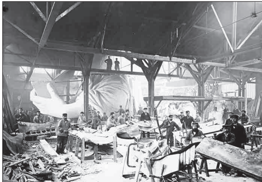
کارگاه ساخت تندیس آزادی در پاریس - ۱۸۸۳

عمودی ۱ ماده اولیه صابون - لفافه ۲ - نماد لاغری - جمع مفهوم - یک شصتم دقیقه ۳ - پایگانی - دلالت کننده - فکر و اندیشه ۴ - بخشنده - طلا - جایگاه و زیستگاه ۵ - یک گونه از جانوران - درد ۵ - جنگ در راه دین - مغازه - مهم ترین جشنواره فیلم ۶ - به وقوع پیوسته - فلانی - نخ از جاعی ۷ - رگی که خون را به قلب برمی گرداند - از بیماری های متداول فصلی ۸ - عید رمضان - کشتی جنگی - نماد چسبندگی - جواب مثبت ۹ - نجات دادن و آزاد کردن - کسی که با پرداخت مبلغی اجازه زراعت در ملک دیگران را دارد ۱۰ - شهر خرما - خارهای نازک خوشه گندم - خریس ترکی ۱۱ - درخت انگور - زبان - مربوط به ریه ۱۲ - اسیر کردن - جذاب و دل فریب - نیم ساعت - عدد ۱۳ - هیزم - دختر نیست - هر چیز رنگ شده ۱۴ - آنکه هنگام شادی بانگ و آواز بردارد - جماعت و مردم از قبایل مختلف - حرف خطاب ۱۵ - همسایه و کنار هم - کسی که چهار سال تحصیلی را در دانشگاه و در رشته ای خاص گذرانده باشد